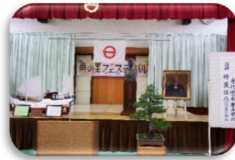
昨年度の文化講演会です。