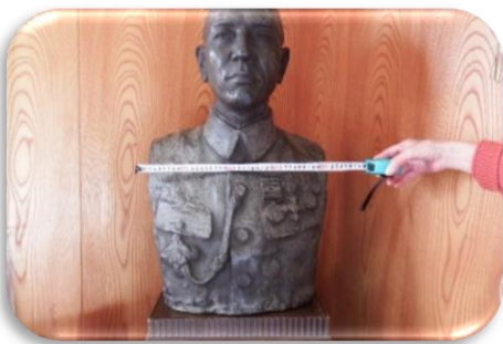
先代の胸像です。 江津市文化財です。 (東洋のロダンといわれる「朝倉文夫」作)

当時の1円は今の紙幣価値では2,000円~3,000円になるそうです。 佐々木準三郎氏の寄付行為は都野津町だけにとどまらず、島根県内の各地にも及んでいたそうです。寄付総額は約五十万円！これを今日の物価に換算すれば、数億円に相当するそうです。